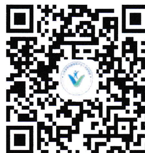
研究院微信公众号